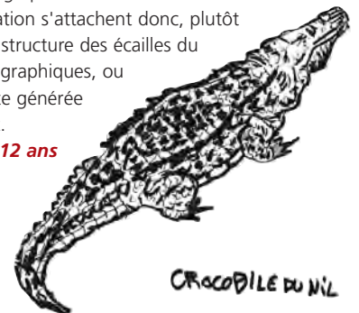
CROCODILE DU NIL