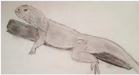
Lyna, 12 ans

8) J'ai apprécié ce cours de dessin, car j'accorde beaucoup d'importance à la nature. Il est donc essentiel pour moi d'illustrer cette beauté.