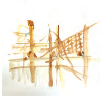
La cage des singes